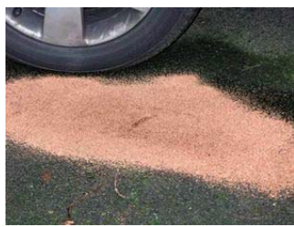
écoulements sur la chaussée