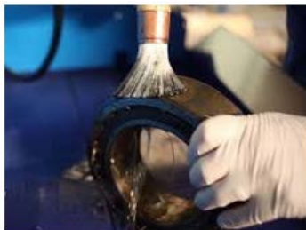
nettoyage des pièces mécaniques